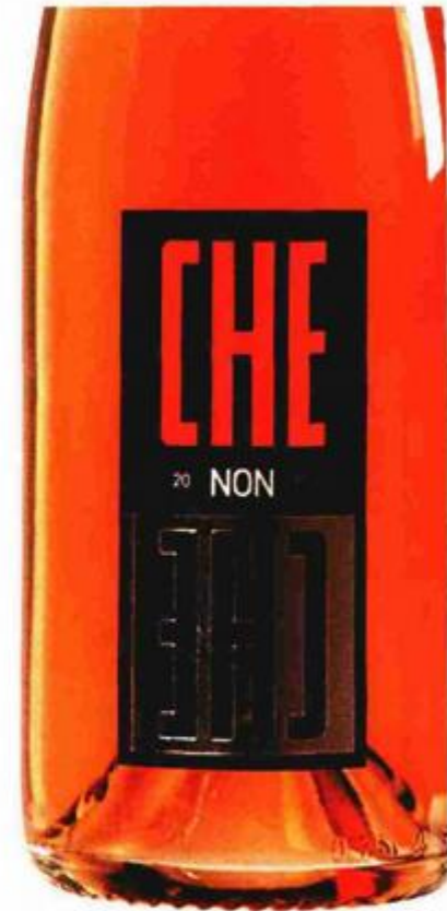
Bezvremenske etikete Kozlovića i Matoševića, rad su Željka Burića iz pulske Fabrike