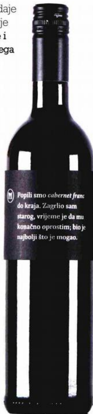
Nešto posve drugačije - iskrena vina s iskrenom pričom podruma Matković