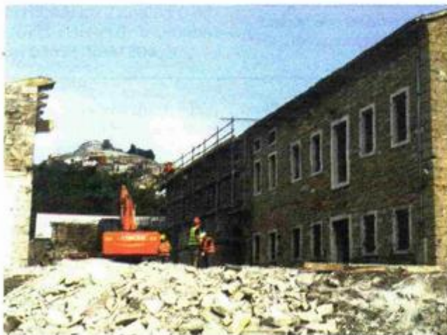
Bager i radnici jučer su već bili aktivni

Spaja se nešto što se do prije 20 godina nije moglo spojiti: poljoprivreda, proizvodnja, skladištenje, kušanje i turizam. Vi danas u ovom mjestu imate ono što je prije u prostornom planu bilo planirano na pet različitih lokacija, kazao je arhitekt Idis Turato iz riječkog Arhitektonskog biroa Turato pridodavši da je njegova arhitektura, kao i vino Roxanich, iskrena, prirodnih materijala i bez suvišnih elemenata: "podrum je ukopan, a hotel lebdi iznad njega".